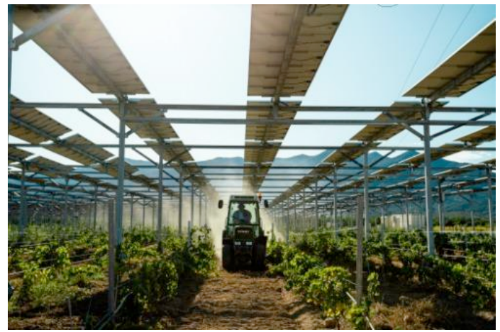
Εικόνα 4: Υπερυψωμένη κατασκευή τύπου “κρεβατίνα”