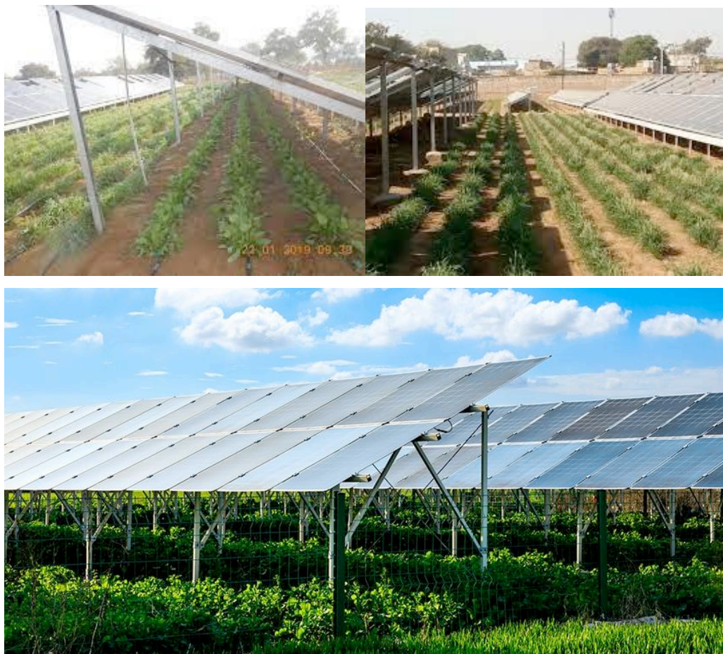
Εικόνα 3: Διπάσσαλο, σταθερό

Για το διπάσσαλο σύστημα στήριξης φωτοβολταϊκών πλαισίων θα είναι δυνατή η αδειοδότηση των αιτήσεων οι οποίες έχουν ήδη υποβληθεί και η εγκατάστασή τους θα γίνει σε πιλοτική φάση ούτως ώστε να διερευνηθεί η ικανότητα του τύπου αυτού για αποτελεσματική διπλή χρήση του τεμαχίου δηλ. για γεωργική αποδοτική αξιοποίηση και παραγωγή ενέργειας.